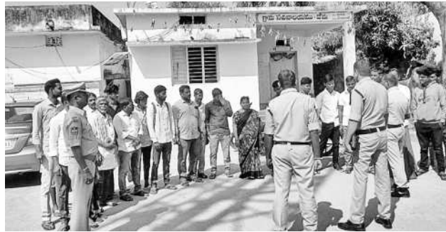
దోమలో వాహనదారులకు రోడ్డు భద్రతా నిబంధనలు వివరిస్తున్న పోలీసులు

చేస్తే అట్టి వారిపై కేసులు నమోదు చేయడం జరుగుతుందని వివరించారు. మద్యం సేవించి వాహనాలు నడపడం నేరమని సూచించారు.