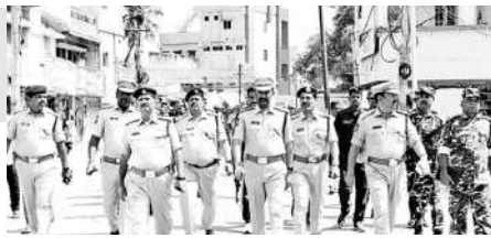
పట్టణంలో కేంద్ర సాయుధ బలగాలతో ఫ్లాగ్ మార్చ్ నిర్వహిస్తున్న ఎస్సీ కోటిరెడ్డి

వికారాబాద్, అక్టోబర్ 26 : శాంతియుత వాతావరణంలో ఎన్నికలను నిర్వహించడానికి ఫ్లాగ్ మార్చ్ నిర్వహిస్తున్నట్లు ఎస్సీ కోటిరెడ్డి తెలిపారు.