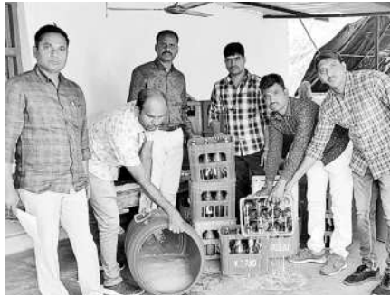
అక్రమ కల్లు నిల్వలను ధ్వంసం చేస్తున్న ఎక్సైజ్, ఎన్.ఫో.ర్.ఎం.ఎం. అధికారులు