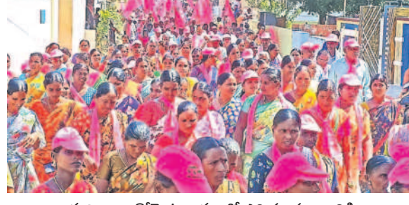
మద్దిరాల : గోరెంట్ల గ్రామంలో ఎన్నికల ప్రచారానికి భారీగా హాజరైన గులాబీ శ్రేణులు