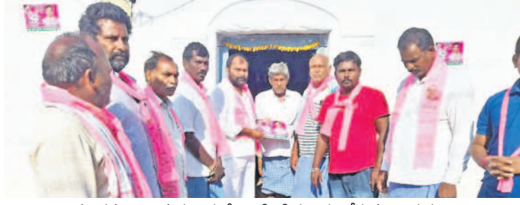
తుంగతుర్తి : గానుగబండలో ఇంటింటి ప్రచారం చేస్తున్న నాయకులు