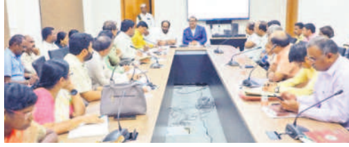
మిల్లర్లు అసోసియేషన్ సభ్యులతో మాట్లాడుతున్న కలెక్టర్ ఎస్.వెంకట్రామ్

కలెక్టర్ ఎస్.వెంకట్రామ్ సూర్యాపేట, అక్టోబర్ 26 : ధాన్యం కొనుగోళ్లలో ఎటువంటి ఇబ్బందులు లేకుండా చూడాలని కలెక్టర్ ఎస్.వెంకట్రామ్ అన్నారు. గురువారం కలెక్టరేట్‌లోని వీడియో కాన్ఫరెన్స్ హాల్‌లో అదనపు కలెక్టర్ వెంకటరెడ్డితో కలిసి మిల్లర్లు, రవాణా కాంట్రాక్టర్లు, అధికారులతో నిర్వహించిన సమావేశంలో ఆయన మాట్లాడారు. జిల్లా వ్యాప్తంగా 285 కొనుగోలు కేంద్రాల ద్వారా 4,15,559 మెట్రిక్ టన్నుల ధాన్యం కొనుగోలు చేయడం జరుగుతుందన్నారు. అందుకు అన్ని ఏర్పాట్లు చేయడం జరిగిందని తెలిపారు. ధాన్యం కొనుగోలు కేంద్రాల వద్ద ప్యాడీ క్లీనర్లు 246, మాయిశ్యర్ మిట్టర్లు 268, ఎలక్ట్రానిక్ వెయింగ్ మిషన్లు 278 అందుబాటులో ఉన్నట్లు చెప్పారు. కొనుగోలు కేంద్రాలను మిల్లలకు ట్యాగింగ్ చేయడం జరుగుతుందని, రేపటి నుంచి జిల్లా