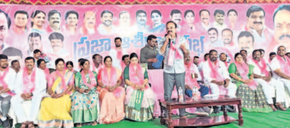
ప్రజా ఆశీర్వాద సభలో మాట్లాడుతున్న ఎంపీ రంజిత రెడ్డి, తదితరులు

అందిస్తున్నారని తెలిపారు. నేడు దేశంలోనే అన్ని రంగాల్లో రాష్ట్రం ముందంజలో ఉందన్నారు. ప్రజా సంక్షేమానికి అనేక సంక్షేమ పథకాలు అమలు చేస్తున్నారని, వీటితో ప్రజలకు లబ్ధి చేకూరిందన్నారు. పుట్టిన బిడ్డకు కేసీఆర్ కిట్ తో పాటు ఆడబిడ్డల పెండ్లికి కల్యాణలక్ష్మి పథకం లక్షానుబంధపథకం అందజేస్తున్నట్లు చెప్పారు. దశిచ బంధు, బీసీ బంధు ఇచ్చామని, గృహలక్ష్మి పథకాలను అమలు చేస్తున్నామని తెలిపారు. బీఆర్ఎస్ ఎన్నికల మ్యానిఫె