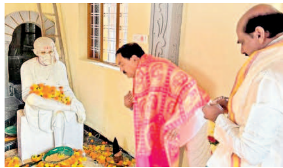
సాయిబాబా విగ్రహ ప్రతిష్ఠాపన పూజలు చేస్తున్న మంత్రి ఎర్రబెల్లి