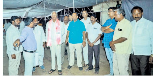
ఆత్మీయ సమావేశం ఏర్పాట్లను పరిశీలిస్తున్న కడియం శ్రీవారి

కేసీఆర్ పాలనలో సంక్షేమం సీఎం కేసీఆర్ పాలనలో అధిక నిధులు కేటాయించి