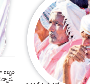
వర్ధన్నపేట సభలో సీఎం కేసీఆర్ కు జై కొడుతున్న ప్రజలు