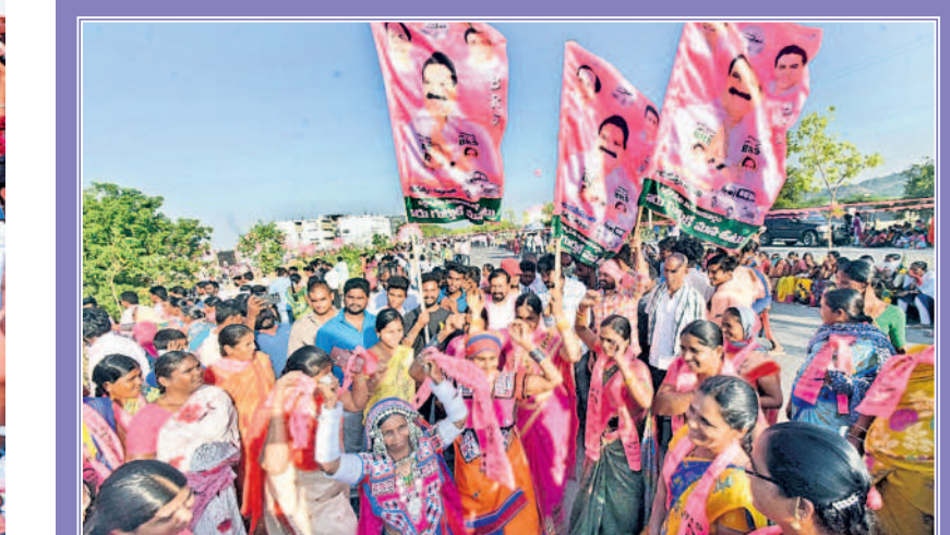
వర్ధన్నపేట సభలో ఎమ్మెల్యే అరూరి జెండాలు చేతపట్టి నృత్యం చేస్తున్న మహిళలు