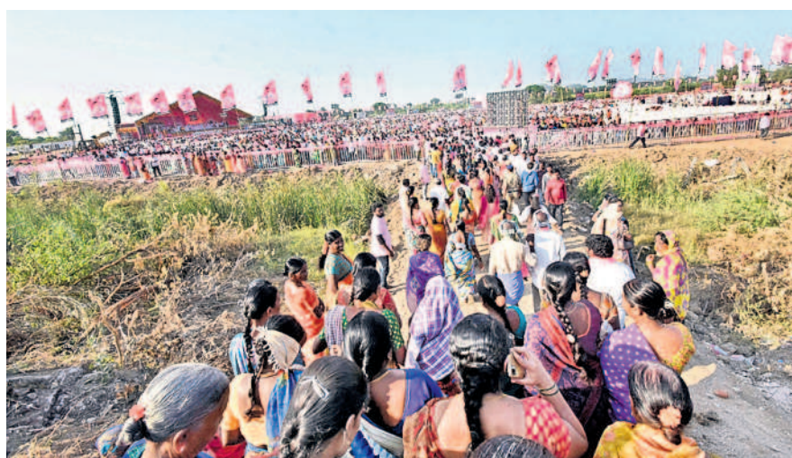
వర్ధన్నపేట సభకు దండులా తరలివస్తున్న ప్రజలు