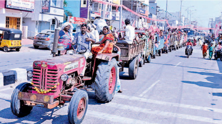
మానుకోట సభా వాహనాల్లో ర్యాలీగా వస్తున్న జనం