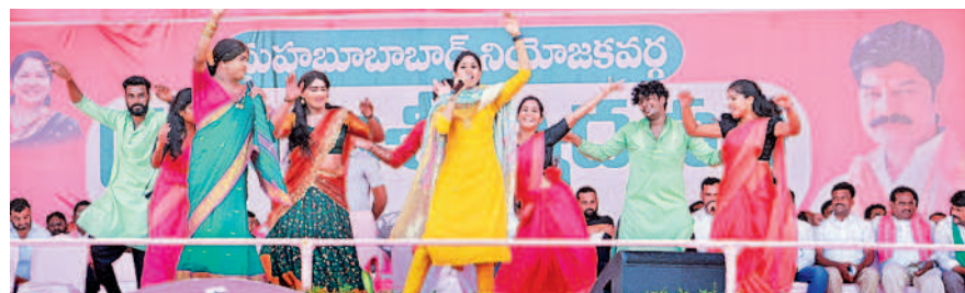
మహబూబాబాద్ ప్రజా ఆశీర్వాద సభలో మధుప్రియ, జబర్దస్త్ కళాకారులు ఆటపాట