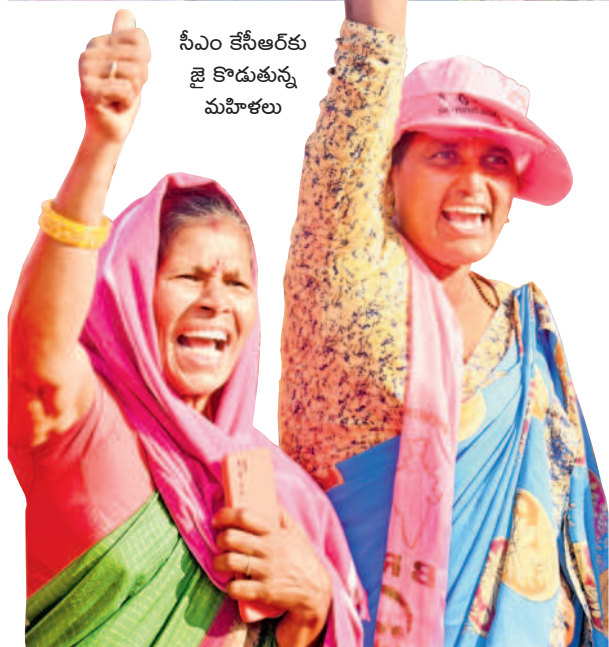
సీఎం కేసీఆర్ కు జై కొడుతున్న మహిళలు