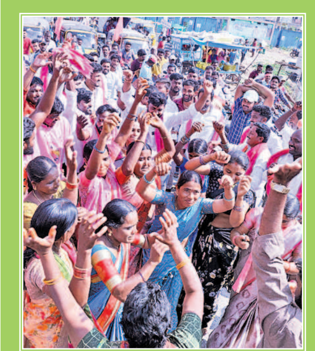
మానుకోట సభా ప్రాంగణం వద్ద ఉత్సాహంగా నృత్యం చేస్తున్న ప్రజలు