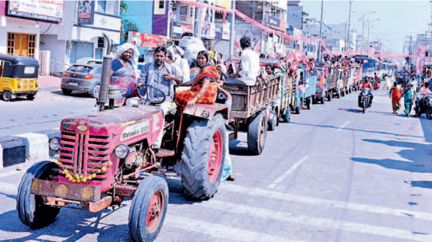
మానుకోట సభా వాహనాల్లో ర్యాలీగా వస్తున్న జనం