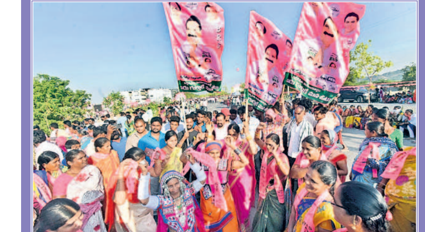
వర్ధన్నపేట సభలో ఎమ్మెల్యే అరూరి జెండాలు చేతపట్టి నృత్యం చేస్తున్న మహిళలు