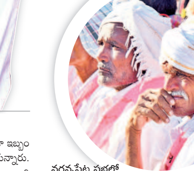
వర్ధన్నపేట సభలో సీఎం కేసీఆర్ కు జై కొడుతున్న ప్రజలు