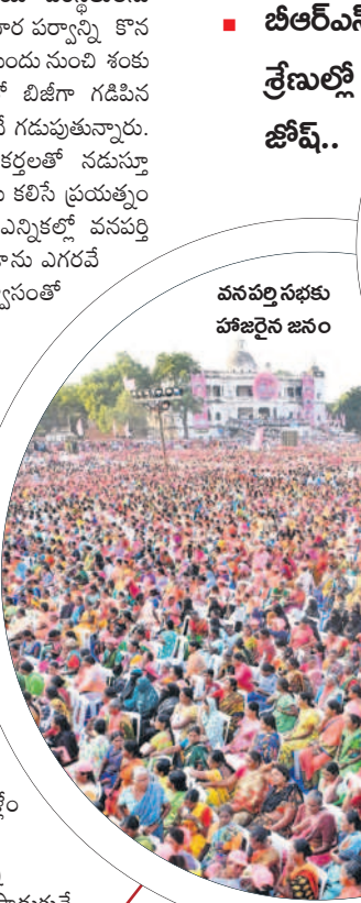
వనపర్తి సభకు హాజరైన జనం

ప్రతిపక్షాలు కుదేలు.. అచ్చంపేటలో సీఎం కేసీఆర్ సభ ద్వారా అచ్చంపేటలో బీఆర్ఎస్ గ్రాఫ్ మరింత పెరిగింది. ఇంటింటికి వెళ్లి ప్రజలను కలిసే ప్రయత్నం చేస్తున్నారు. ప్రజా ఆశీర్వాద సభ గ్రాండ్ కార్యక్రమాన్ని సమన్వయం చేస్తూ ఎలాంటి ఒడిదుడుకులకు లోసుకాకుండా చర్యలు తీసుకుంటున్నారు. అచ్చంపేట ప్రజా ఆశీర్వాద సభ గ్రాండ్ కార్యక్రమాన్ని సమన్వయం చేస్తూ ఎలాంటి ఒడిదుడుకులకు లోసుకాకుండా చర్యలు తీసుకుంటున్నారు. అచ్చంపేట ప్రజా ఆశీర్వాద సభ గ్రాండ్ కార్యక్రమాన్ని సమన్వయం చేస్తూ ఎలాంటి ఒడిదుడుకులకు లోసుకాకుండా చర్యలు తీసుకుంటున్నారు.