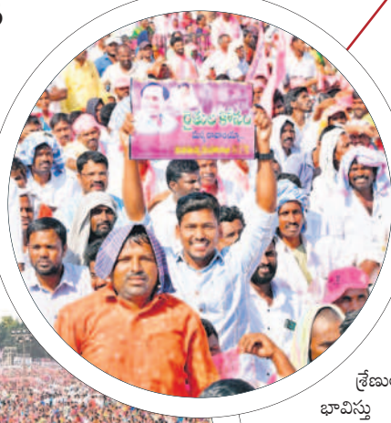
శ్రేణులు భావిస్తున్నారని. ప్రతిపక్షాలు భయపడి గ్రామాల నుంచి సభకు ఎంతమంది, ఎవరెవరు వెళ్లారనేది ఆరా తీస్తున్నట్లు తెలిసింది. అచ్చంపేట కాంగ్రెస్ శ్రేణులు ఢీలా పడడంతోపాటు పునరాలోచన చేస్తున్నారు. అచ్చంపేట నియోజకవర్గంలో బీఆర్ఎస్ పార్టీ

వృద్ధిని చూస్తున్న సల్మల ప్రజాసేవకం మూడోసారి సీఎం కేసీఆర్ ను దీవించి సీఎం కేసీఆర్ కు ఆశీర్వాదాలు చేస్తున్నారని తెలుసుకుంటున్నాం. ఇదంతా గమనిస్తున్న ఆయా పార్టీల క్యాడర్ ఇప్పటికే బీఆర్ఎస్ లోకి వలస బాట పట్టింది.