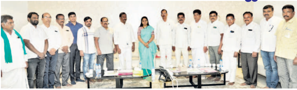
ఎమ్మెల్సీ కవితతో రెడ్డి ఐక్యవేదిక నాయకులు

కామారెడ్డి, అక్టోబర్ 27 : సీఎం కేసీఆర్ గెలుపు కామారెడ్డికి ముంత శక్తిని ఇస్తుందని, ఈ ప్రాంతం శాశ్వత అభివృద్ధి చెందుతుందని ఎమ్మెల్సీ కల్వకుంట్ల కవిత అన్నారు. కామారెడ్డి ప్రాంతం రూపురేఖలు మారుతాయని, కామారెడ్డి జిల్లానే కాకుండా ఉమ్మడి నిజామాబాద్ జిల్లాతోపాటు హిరుగున ఉన్న జిల్లాలు అభివృద్ధి చెందుతాయని అన్నారు. కామారెడ్డి జిల్లాకు చెందిన రెడ్డి ఐక్యవేదిక నాయకులు హైదరాబాద్ లో ఎమ్మెల్సీ కల్వకుంట్ల కవితతో శుక్రవారం సమావేశమయ్యారు. కామారెడ్డిలో సీఎం కేసీఆర్ అభ్యుత్థానికి సంపూర్ణ మద్దతు ప్రకటించారు. ఈ సందర్భంగా ఆమె మాట్లాడుతూ.. కామారెడ్డిలో సీఎం కేసీఆర్ పోటీ చేస్తున్నారని ప్రకటించగానే కార్యకర్తల్లో ఉత్సాహం వచ్చిందన్నారు.