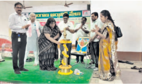
ఆర్గానిక్ మేళాను ప్రారంభిస్తున్న నాబార్డు డిప్యూటీ జనరల్ మేనేజర్ దీప్తి