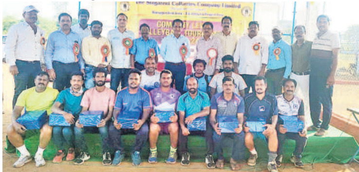
రన్నర్స్ గా నిలిచిన బెల్లంపల్లి అండ్ మందమర్రి ఏరియా జట్టు