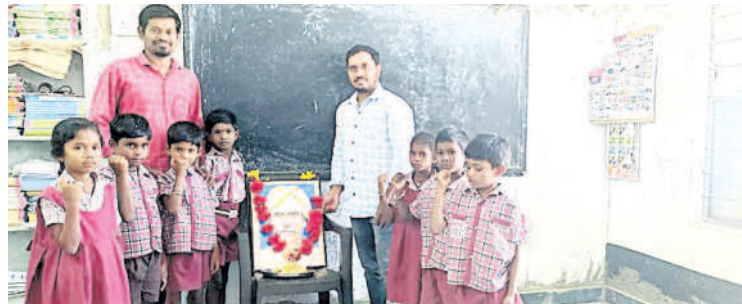
కుమ్రం భీం చిత్రపటానికి పూలమాల వేసి నివాళులర్పిస్తున్న విద్యార్థులు, ఉపాధ్యాయులు