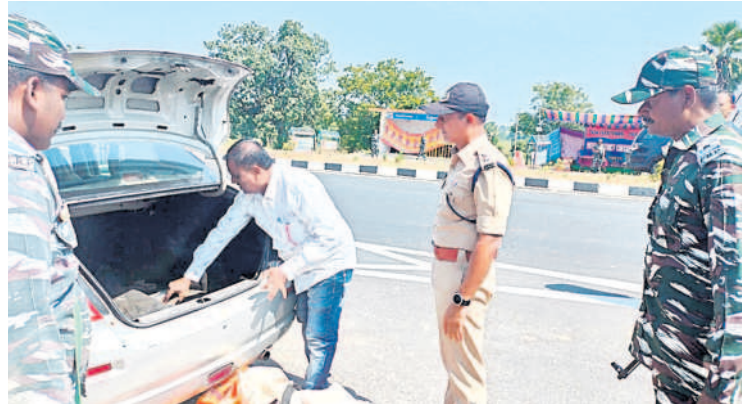
రెబ్బెన చెక్ పోస్ట్ వద్ద కారులోని వస్తువులు తనిఖీ చేస్తున్న కుమ్రం భీం ఆసిఫాబాద్ ఎస్పీ సురేశ్ కుమార్

అధికారులు, రైస్ మిల్ యజమానులు కుమ్మక్కై ఎఫ్సీఐని మోసం చేస్తున్నారని సభ్యుడు బుర్ర సురేందర్ గౌడ్ ఆరోపించారు.