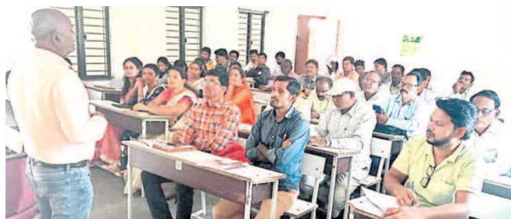
ఉపాధ్యాయులతో మాట్లాడుతున్న ఎంఈవో

సిర్పూర్(యా), అక్టోబర్ 27 : బడిడు పిల్లలు స్కూల్లోనే ఉండేలా చూడాలని ఎంఈవో కుద్దెత సుధాకర్ అన్నారు. మండలంలోని తెలంగాణ మోడల్ స్కూల్లో ప్రభుత్వోపాధ్యాయులతో శుక్రవారం సమావేశం నిర్వహించారు. ఈ సందర్భం