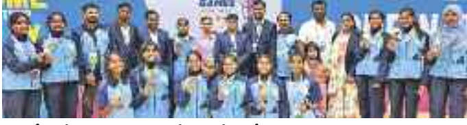
గోవా వేదికగా జరుగుతున్న నేషనల్ గేమ్స్లో తెలంగాణ మహిళల నెట్ బాల్ జట్టు కాంస్య పతకం సొంతం చేసుకుంది. తెలంగాణ, కేరళ మధ్య హోదాహోలగా సాగిన మ్యాచ్ 28-28తో టైగా ముగిసింది.