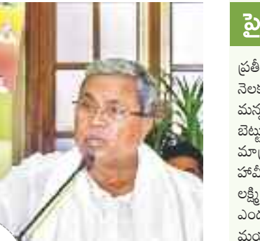
చెప్పింది. నెలకు ఒక్కో ఖాతాలో కిలోల బియ్యం కిలో రూ.34 జము చేసింది. అది పూర్తిగా చేయట్లేదు.

భాగ్యంలేని 'అన్నభాగ్య' ఎన్టీఆర్ సమయంలో 'అన్నభాగ్య' స్కీమ్ ను ఆర్థికంగా ప్రచారం చేసిన కాంగ్రెస్.. అధికారంలోకి రాగానే బియ్యం ధోరణులకు లక్ష్యాలు గోల్తులు పెట్టింది. 10 కిలోల బియ్యం 5 కిలోలకు తగ్గించి రైస్ బియ్యం డబ్బులు ఇస్తామని ప్రకటించి అంతలోనే మెలికపెట్టింది. గతంలో రేషన్ దుకాణాల ద్వారా పంపిణీ చేసిన బియ్యం కొరత కిలోల ఎంతధర ఉండేదో అంతే ఇస్తామని