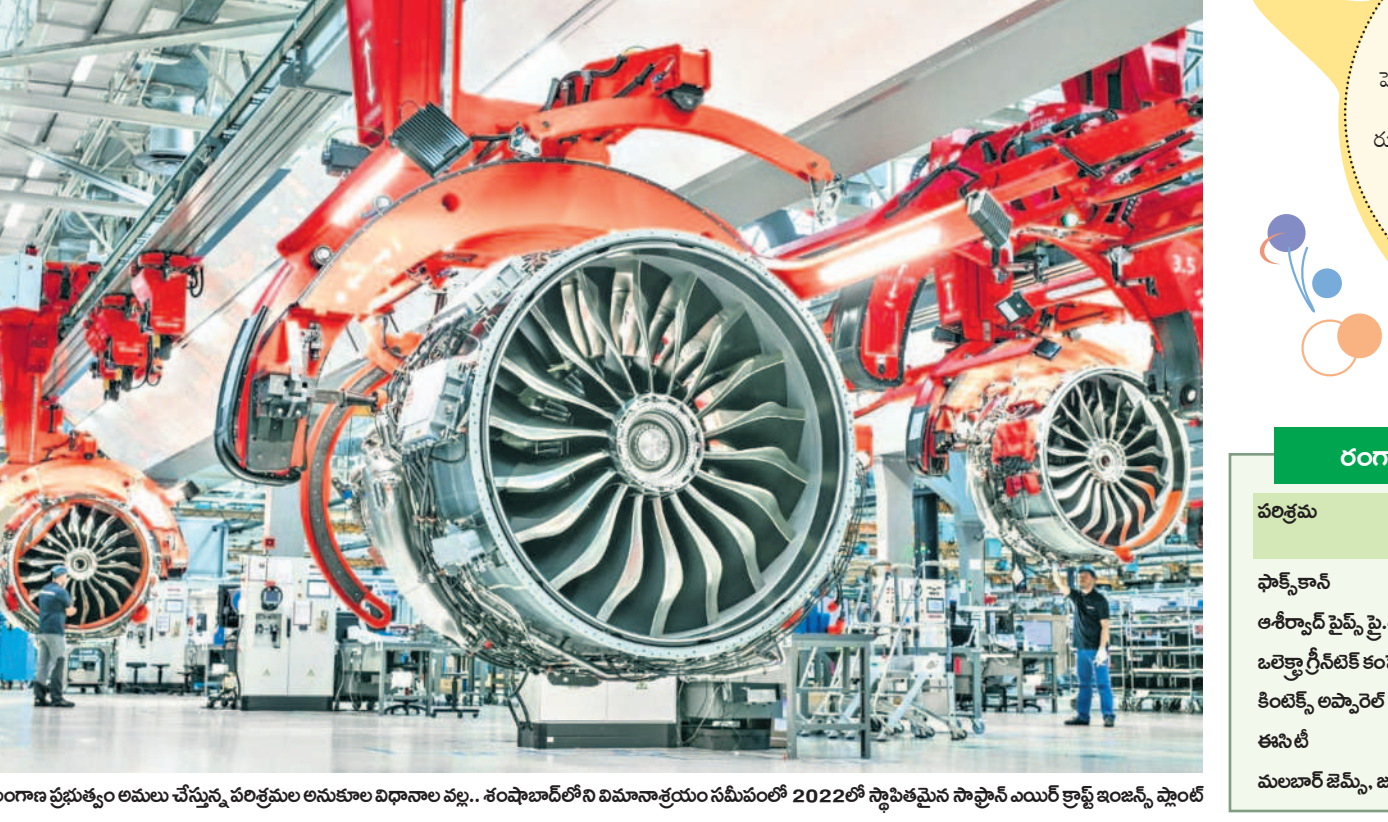
తెలంగాణ ప్రభుత్వం అమలు చేస్తున్న పరిశ్రమల అనుకూల విధానాల వల్ల.. శంషాబాద్ లోని విమానాశ్రయం సమీపంలో 2022లో స్థాపించిన సాఫ్టవేర్ ఇంజనీరింగ్ ఫ్యాక్టరీ