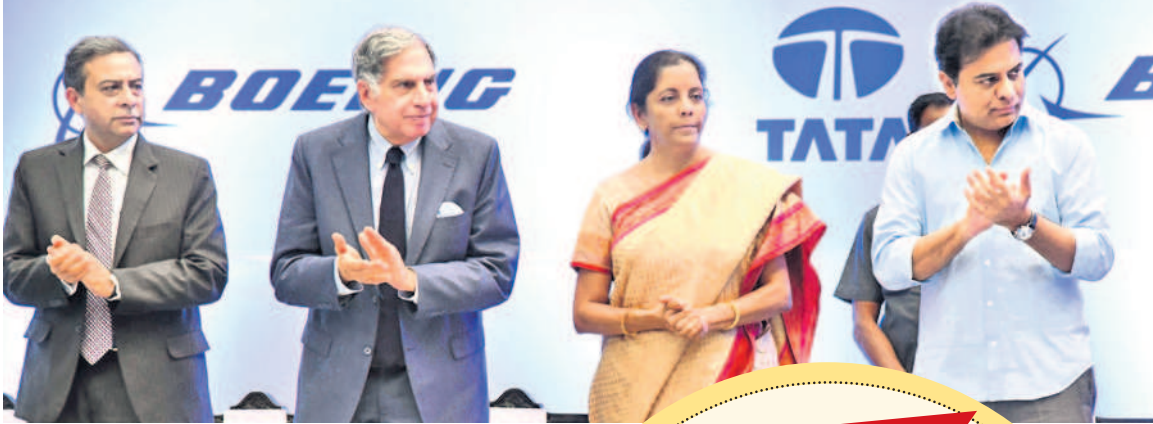
టాటా బోయింగ్ ఏరోస్పేస్ ఫెసిలిటీ ప్రారంభోత్సవంలో కేంద్ర ఆర్థిక మంత్రి నిర్మలా సీతారామన్, మంత్రి కేటీఆర్, ప్రముఖ పారిశ్రామిక వేత్త రకన్ టాటా (పైల్)