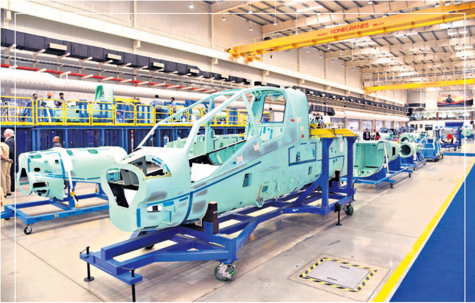
పారిశ్రామిక రంగంలో తెలంగాణ అభివృద్ధికి ఉండేందుకు జరిగిన నిరంతర శ్రమకు ఫలితంగా 2018లో ఆదిట్టంలో ప్రారంభమైన టాటా బోయింగ్ ఏరోస్పేస్ మాన్యుఫ్యాక్చరింగ్ ఫెసిలిటీ