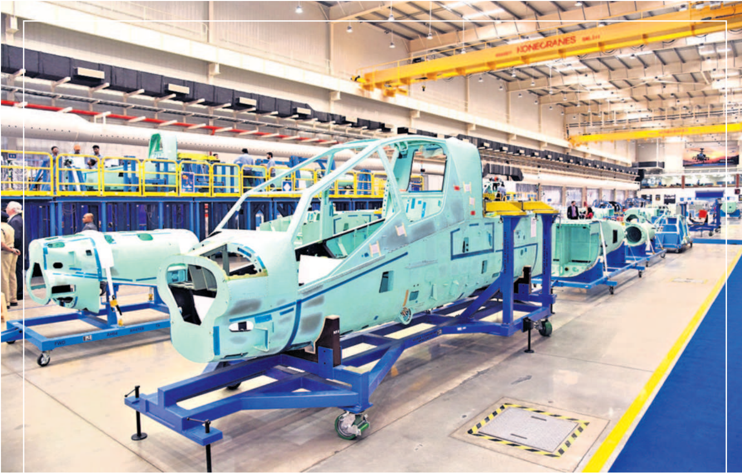
పారిశ్రామిక రంగంలో తెలంగాణ ఇంజనీరింగ్ యూనివర్సిటీ నుండి నిరంతర శ్రమకు ఫలితంగా 2018లో ఆదిట్టంలో ప్రారంభమైన టాటా బోయింగ్ ఏరోస్పేస్ మాన్యుఫ్యాక్చరింగ్ ఫెసిలిటీ