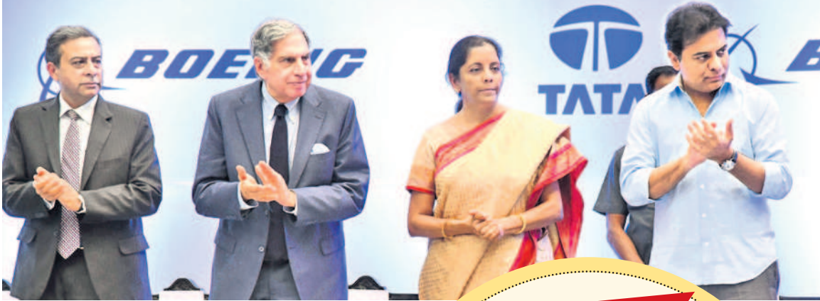
టాటా బోయింగ్ ఏరోస్పేస్ ఫెసిలిటీ ప్రారంభోత్సవంలో కేంద్ర ఆర్థిక మంత్రి నిర్మలా సీతారామన్, మంత్రి కేటీఆర్, ప్రముఖ పారిశ్రామిక వేత్త రకన్ టాటా (మీద)