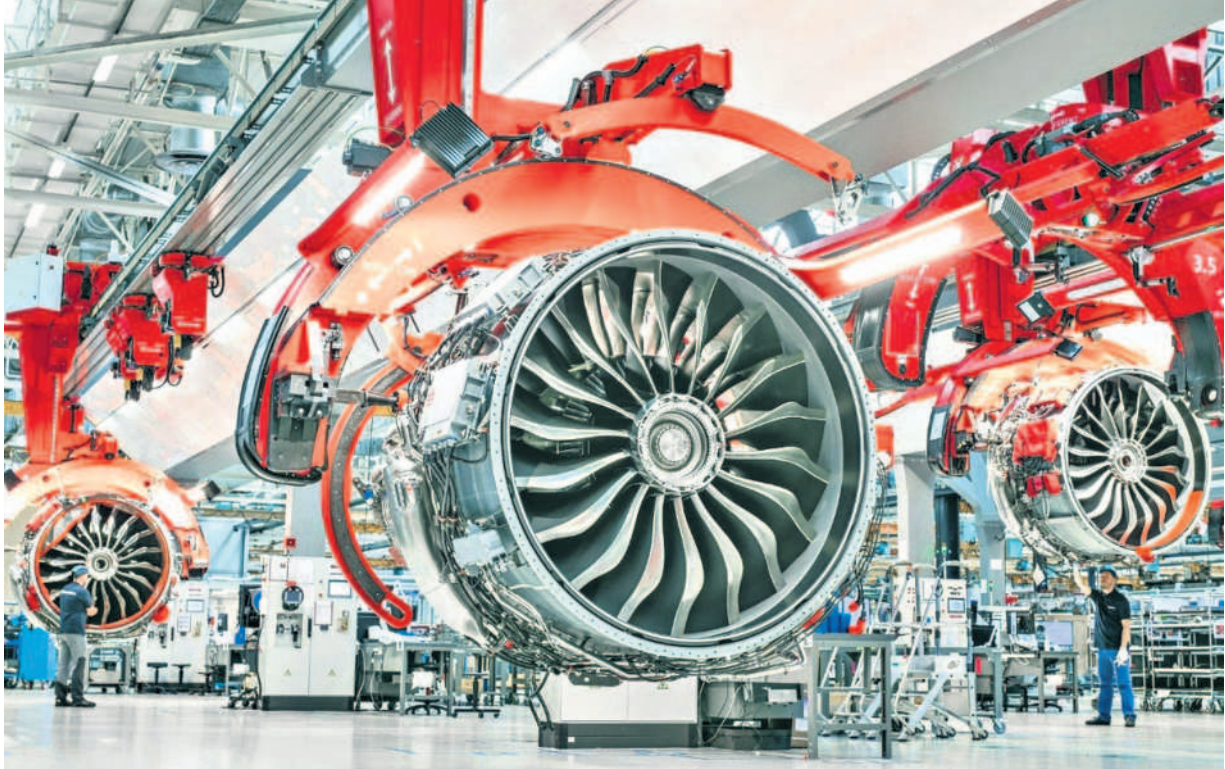
తెలంగాణ ప్రభుత్వం అమలు చేస్తున్న పరిశ్రమల అనుకూల విధానాల వల్ల.. శంషాబాద్ లోని విమానాశ్రయం సమీపంలో 2022లో స్థాపించిన సాఫ్టవేర్ ఇంజనీరింగ్ ఫ్యాంట్

-మేడ్చల్/రంగారెడ్డి, అక్టోబర్ 27 (నవమి తెలంగాణ)