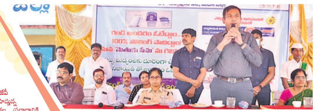
సమావేశంలో మాట్లాడుతున్న జిల్లా ఎన్నికల అధికారి రాజర్షి షా