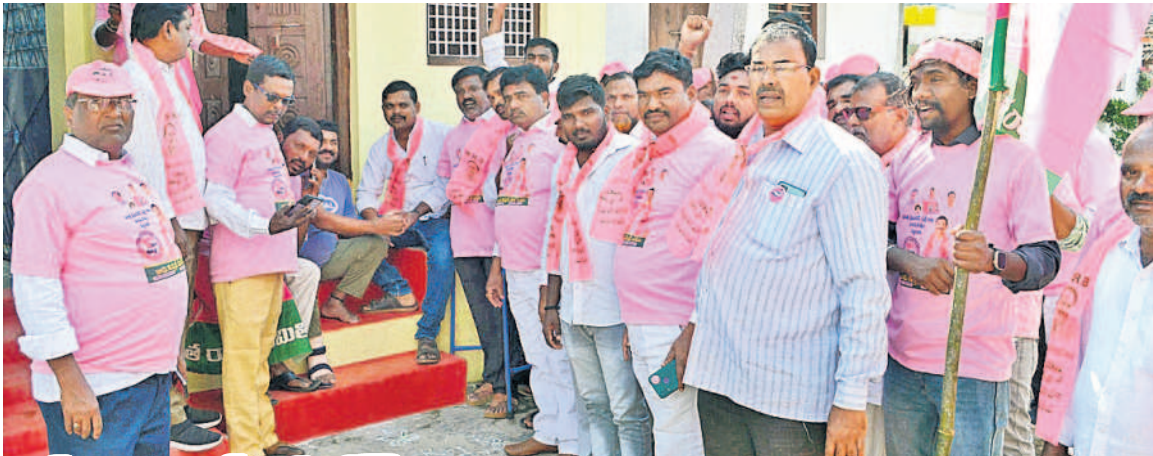
దుబ్బాకలో బీఆర్ఎస్ అభ్యర్థి, ఎంపీ కొత్త ప్రభాకర్ రెడ్డికి మద్దతుగా ఇంటింటి ప్రచారం నిర్వహిస్తున్న బీఆర్ఎస్ నాయకులు, ప్రజాప్రతినిధులు, కార్యకర్తలు