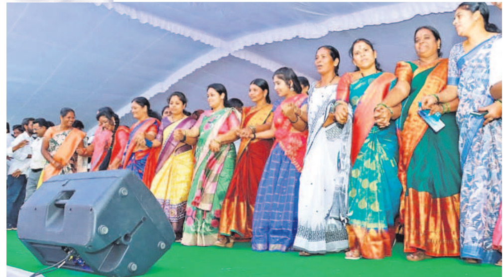
అందోల్ : సృష్టించే స్ఫూర్తి మహిళా ప్రజాప్రతినిధులు, కళాకారులు