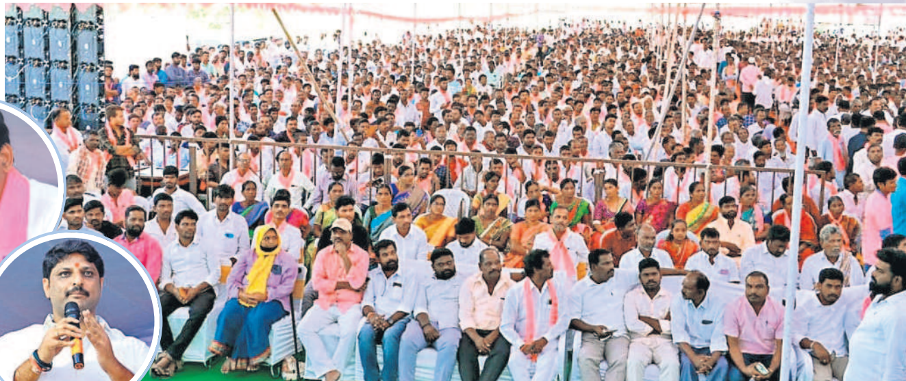
కార్యక్రమానికి హాజరైన బీఆర్ఎస్ శ్రేణులు, నాయకులు, ప్రజలు