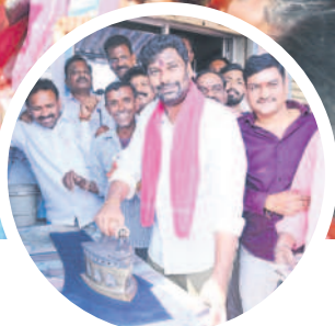
మందమిర్రలో ఐరన్ చేస్తూ..