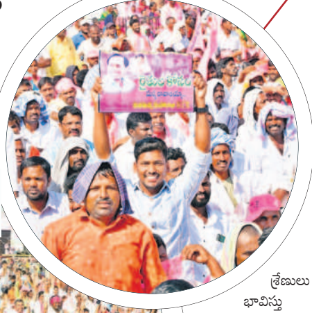
అచ్చంపేట సభలో సీఎం కేసీఆర్ ప్రసంగానికి జై గాడుతున్న ప్రజలు

శ్రేణులు భావిస్తున్నారు. ప్రతిపక్షాలు భయపడి గ్రామాల నుంచి సభకు ఎంత మంది, ఎవరెవరు వెళ్లారనేది ఆరా తీస్తున్నట్లు తెలిసింది. అచ్చంపేట కాంగ్రెస్ శ్రేణులు ఢీలా పడడంతోపాటు పునరాలోచన చేస్తున్నారు. అచ్చంపేట నియోజకవర్గంలో బీఆర్ఎస్ పార్టీ