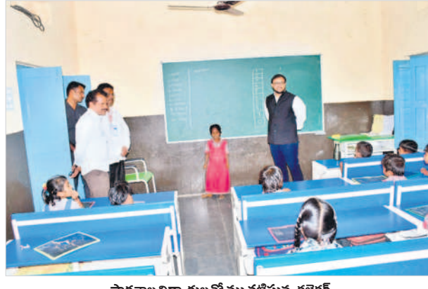
పాఠశాల విద్యార్థులతో ముచ్చటపెట్టిన కలెక్టర్