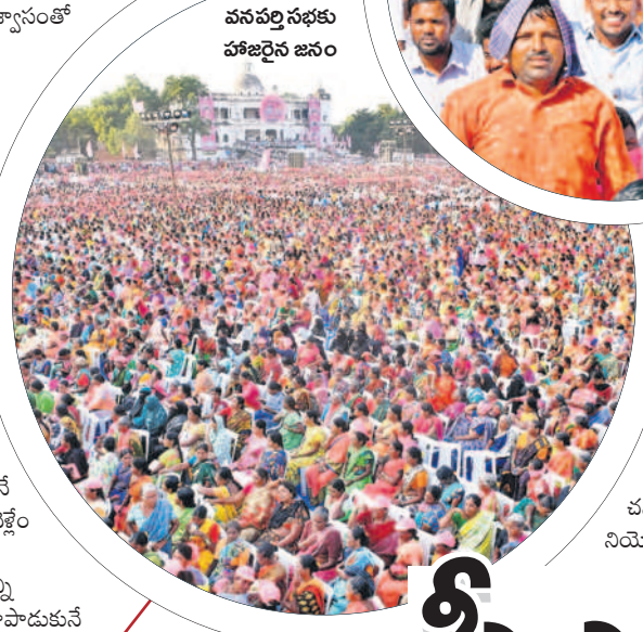
వనపర్తి సభకు హాజరైన జనం

ప్రతిపక్షాలు కుదేలు.. అచ్చంపేటలో సీఎం కేసీఆర్ సభ ద్వారా అచ్చంపేటలో బీఆర్ఎస్ గ్రాఫ్ మరింత పెరిగినట్లు ఇంటింటికి వెళ్లడం తెలిపాయి. సభను చూసిన తర్వాత ప్రతిపక్షాల గుండెల్లో రైళ్లు పరుగెడుతున్నాయి. ప్రతిపక్షాలు ఆలోచనలో పడ్డారని అక్కడక్కడ గుసగుసలు వినిపిస్తున్నాయి. అయితే సభకు వచ్చే వారి సంఖ్యను చూసిన తర్వాత ప్రతిపక్ష నాయకులు జైత్రం చేసుకోవడం లేదు. బయట మేకపోతు గాంభీర్యం ప్రదర్శిస్తున్న లోపల ఓటమి భయం పట్టుకుంది. నిన్ను మొన్నటి వరకు గల్లలు ఎగిరేసిన ప్రతిపక్షాలు సభ చూసిన జనాన్ని చూసి ఆలోచనలో పడ్డారు. అచ్చంపేటలో బీఆర్ఎస్ విజయం తెలిపాయింది. మరోసారి అచ్చంపేటలో కాంగ్రెస్ ఖతం కానున్నదని తెలుస్తోంది. జనం స్పందన బట్టి బీఆర్ఎస్ గెలుపును ఆపేక్షిస్తే ఎవరికీ లేదని పార్టీ