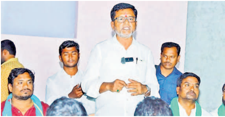
ఆత్మీయ సమ్మేళనంలో మాట్లాడుతున్న పుట్ట మధూకర్