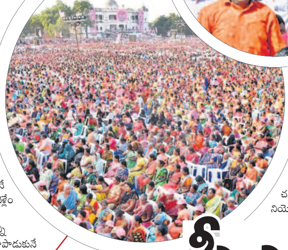
వనపర్తి సభకు హాజరైన జనం