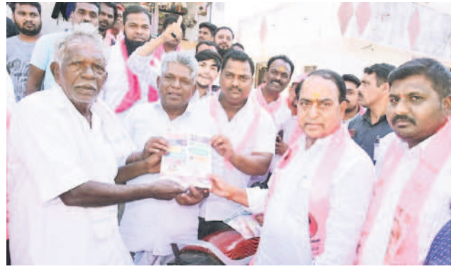
నిర్మల్ అర్బన్ : ప్రచారంలో భాగంగా మ్యానిఫెస్టోను ఓదిరుకు అందజేస్తున్న మంత్రి అల్లీల