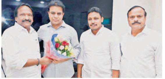
మంత్రి కేటీఆర్కు పుష్పగుచ్ఛం అందిస్తున్న గుర్యయ్యయాదవ్, పక్కన ఎమ్మెల్యే భగత్, మాజీ ఎమ్మెల్యే ప్రభాకర్

నిడమనూరు, అక్టోబర్ 27 : నాయకులంతా కలిసికట్టుగా పనిచేసి బీఆర్ఎస్ను భారీ మెజార్టీతో గెలిపించాలని మంత్రి కేటీఆర్ పిలుపునిచ్చారు. అందిస్తున్న గుర్యయ్యయాదవ్, పక్కన ఎమ్మెల్యే భగత్, మాజీ ఎమ్మెల్యే ప్రభాకర్