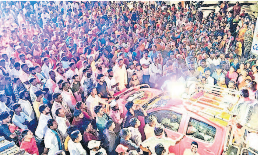
చేపూర్లో నిర్వహించిన ఆశీర్వాద యాత్రలో పాల్గొన్న గ్రామస్థులు