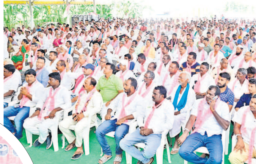
సమావేశంలో పాల్గొన్న కార్యకర్తలు

కార్యకర్తల విస్తృతస్థాయి సమావేశంలో మంత్రి వేముల