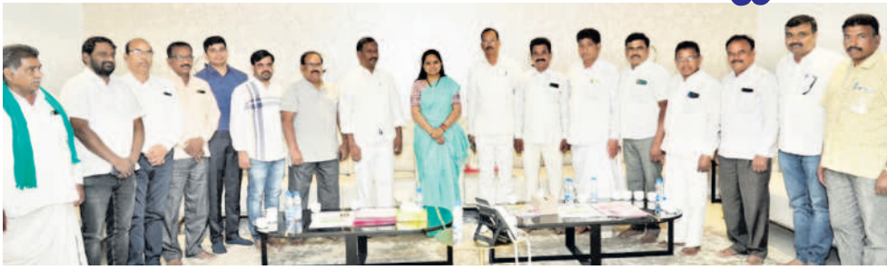
అమ్మెల్సీ కవితతో రెడ్డి ఐక్యవేదిక నాయకులు

కామారెడ్డి, అక్టోబర్ 27 : సీఎం కేసీఆర్ గెలుపు కామారెడ్డికి ముంత శక్తిని ఇస్తుందని, ఈ ప్రాంతం శాశ్వత అభివృద్ధి చెందుతుందని అమ్మెల్సీ కల్యాణకంట్ల కవిత అన్నారు. కామారెడ్డి ప్రాంతం రూపురేఖలు మారుతాయని, కామారెడ్డి జిల్లానే కాకుండా ఉమ్మడి నిజామాబాద్ జిల్లాతోపాటు హిరుగున ఉన్న జిల్లాలు అభివృద్ధి చెందుతాయని అన్నారు. కామారెడ్డి జిల్లాకు చెందిన రెడ్డి ఐక్యవేదిక నాయకులు హైదరాబాద్ లో అమ్మెల్సీ కల్యాణకంట్ల కవితతో శుక్రవారం సమావేశమయ్యారు.