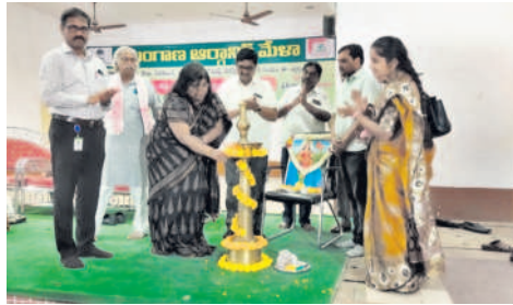
ఆర్గానిక్ మేళాను ప్రారంభిస్తున్న నాబార్డు డిప్యూటీ జనరల్ మేనేజర్ దీప్తి