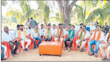
విలేకరులతో మాట్లాడుతున్న బీజేపీ నాయకులు

వేములవాడ, అక్టోబర్ 27: భారతీయ జనతా పార్టీలో టికెట్ లొల్లి రోజురోజుకూ ముదురుపోతున్నది. వేములవాడ అసెంబ్లీ స్థానానికి దాదాపు పదిమందికి పైగా అభ్యర్థులు దరఖాస్తు చేసుకోగా, ఎవరికి వారి ప్రయత్నాలు ముమ్మరం చేసినప్పటికీ మొదటి జాబితాలో మాత్రం స్థానం దక్కలేదు. రెండు రోజుల్లో రెండో జాబితా విడుదల అవుతుందన్న నేపథ్యంలో టికెట్ పంజాయతీ మరోసారి