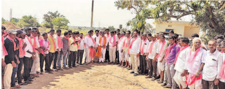
బీఆర్ఎస్ లో చేరిన తుమ్మలపల్లి గ్రామానికి చెందిన కాంగ్రెస్ నాయకులు