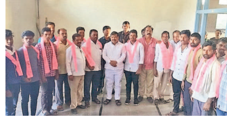
మంత్రి సమక్షంలో బీఆర్ఎస్ పార్టీలో చేరిన పెద్దాపురం కాంగ్రెస్ కార్యకర్తలు