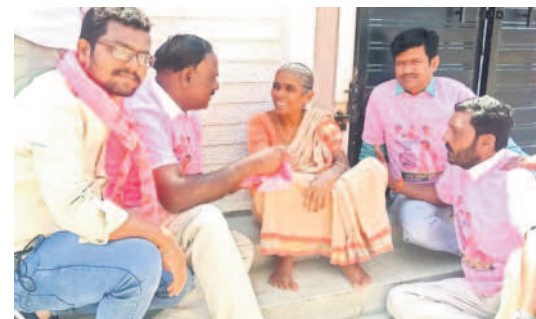
దుబ్బాకలో ప్రచారం నిర్వహిస్తున్న బీఆర్ఎస్ శ్రేణులు ప్రచారంలో కొన్నిలర్లు యాదగిరి, స్వామి, పట్టుణ శాఖ అధ్యక్షుడు పంక