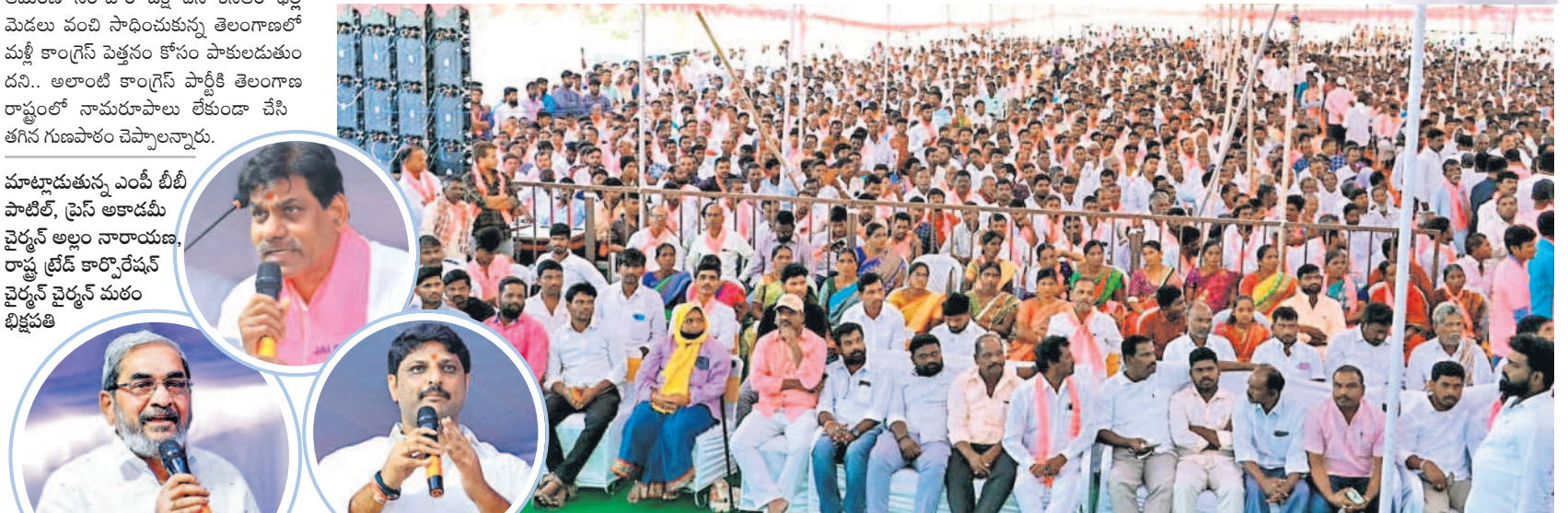
కార్యక్రమానికి హాజరైన బీఆర్ఎస్ శ్రేణులు, నాయకులు, ప్రజలు