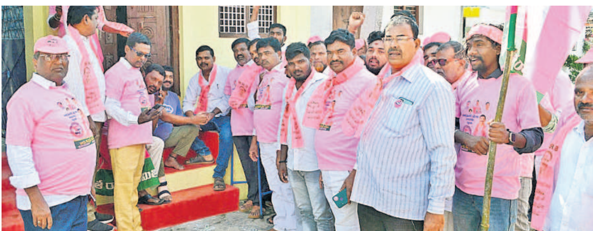
దుబ్బాకలో బీఆర్ఎస్ అభ్యర్థి, ఎంపీ కొత్త ప్రభాకర్ రెడ్డికి మద్దతుగా ఇంటింటి ప్రచారం నిర్వహిస్తున్న బీఆర్ఎస్ నాయకులు, ప్రజాప్రతినిధులు, కార్యకర్తలు

లైన ప్రతిఒక్కరికీ అందేలా చేశారన్నారు. తూప్రాన్ మండలం నుంచి కేసీఆర్ కు అత్యధికంగా ఓట్లు పడితే అందరూ కలిసి కట్టుగా కృషి చేయాలన్నారు. కోట్లాది రూపాయల నిధులతో అన్ని గ్రామాల్లో అభివృద్ధి పనులు తెలంగాణ ప్రభుత్వ హయాంలోనే పూర్తి చేసుకున్నామన్నారు. కార్యక్రమంలో తూప్రాన్ మండల యువకులు పాల్గొన్నారు.