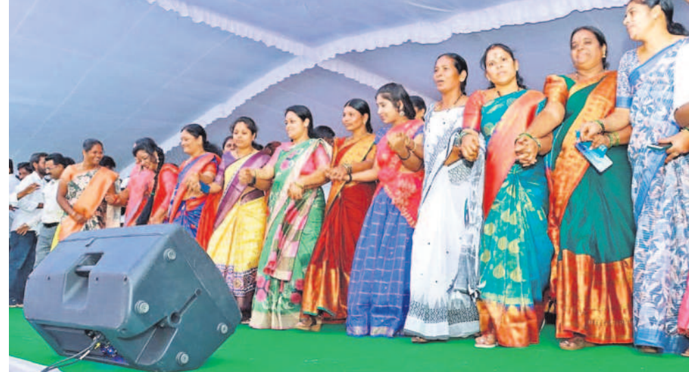
అందోల్: నృత్యం చేస్తున్న మహిళా ప్రజాప్రతినిధులు, కళాకారులు