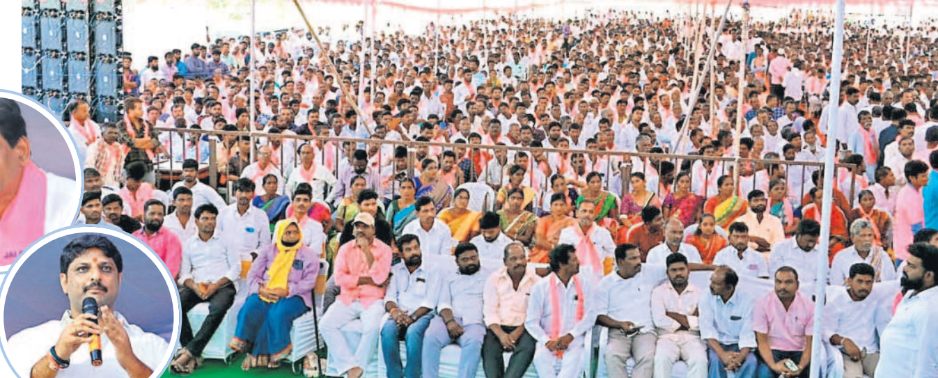
కార్యక్రమానికి హాజరైన బీఆర్ఎస్ శ్రేణులు, నాయకులు, ప్రజలు