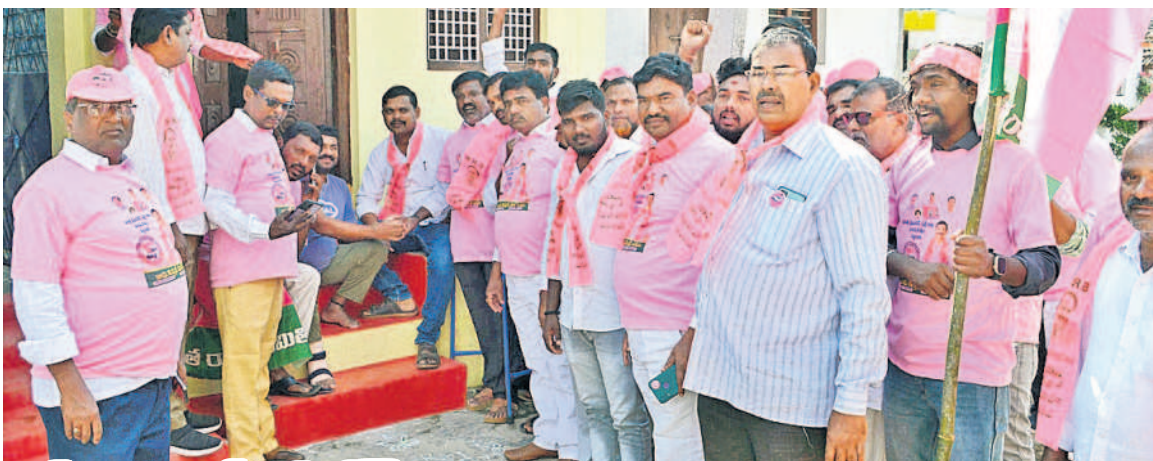
దుబ్బాకలో బీఆర్ఎస్ అభ్యర్థి, ఎంపీ కొత్త ప్రభాకర్ రెడ్డికి మద్దతుగా ఇంటింటి ప్రచారం నిర్వహిస్తున్న బీఆర్ఎస్ నాయకులు, ప్రజాప్రతినిధులు, కార్యకర్తలు

వైస్ ప్రతిఒక్కరికీ అందలా చేశారన్నారు. తూప్రాన్ మండలం నుంచి కేసీఆర్ కు అత్యధికంగా ఓట్లు పడిలా అందరూ కలిసికట్టుగా కృషి చేయాలన్నారు. కోట్లాది రూపాయల నిధులతో అన్ని గ్రామాల్లో అభివృద్ధి పనులు తెలంగాణ ప్రభుత్వ హయాంలోనే పూర్తి చేసుకున్నామన్నారు. కార్యక్రమంలో తూప్రాన్ మండల యువకులు పాల్గొన్నారు.