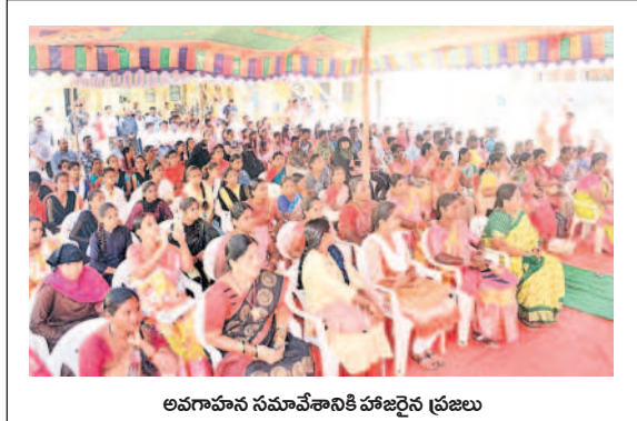
అవగాహన సమావేశానికి హాజరైన ప్రజలు