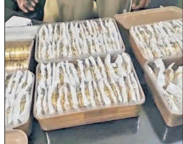
సరైన పత్రాలు లేకుండా గుజరాత్ నుంచి హైదరాబాద్ కు తరలిస్తున్న నగలు