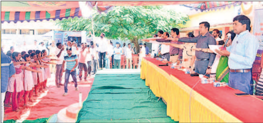
ఓటరు నమోదు కోసం ప్రతిజ్ఞ చేస్తున్న అధికారులు