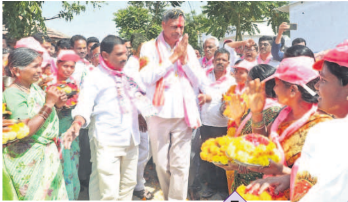
కొమరవెల్లి మండలం బనాపూర్లో 'పల్లా'కు అపూర్వ స్వాగతం పలుకుతున్న మహిళలు