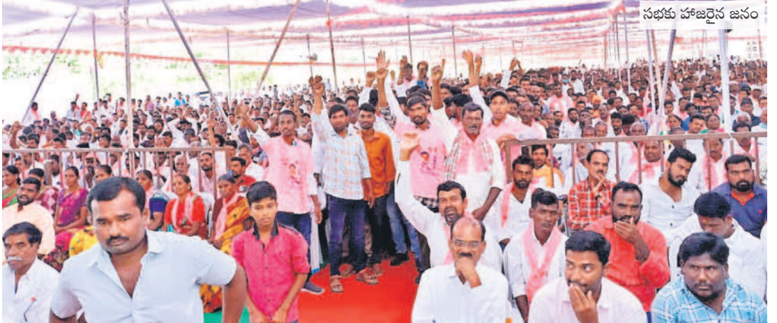
సభకు హాజరైన జనం