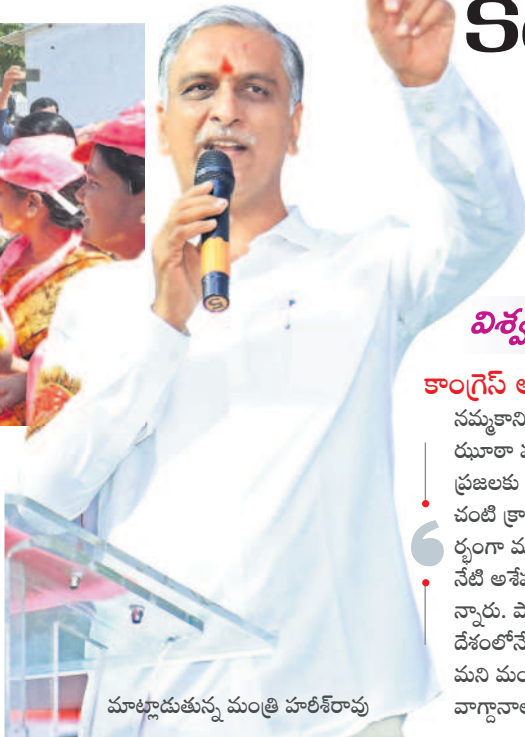
మాట్లాడుతున్న మంత్రి హరిశ్చంద్రుడు