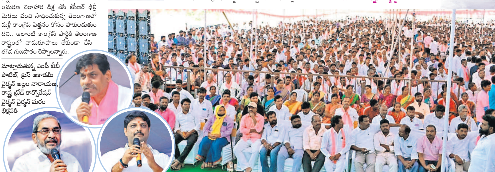
కార్యక్రమానికి హాజరైన బీఆర్ఎస్ శ్రేణులు, నాయకులు, ప్రజలు