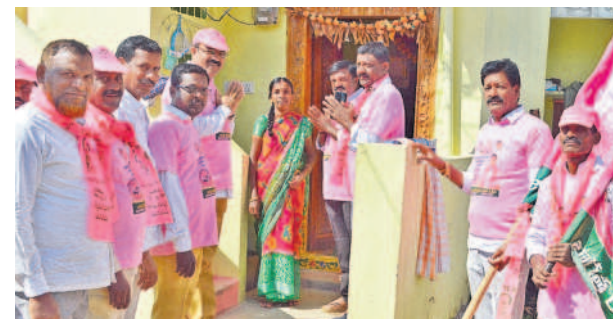
దుబ్బాకలో ప్రచారం నిర్వహిస్తున్న బీఆర్ఎస్ శ్రేణులు

దుబ్బాక అన్ని రంగాల్లో అభివృద్ధి చెందుతుందని వారు ఓటర్లకు వివరించారు. గడిచిన మూడేండ్లలో దుబ్బాక అభివృద్ధిలో ఎంతో మెరుగుదల ముని నేడు ప్రభాకర్ రెడ్డిని గెలిపించుకొని రెడ్డిని పునైతం శ్రీయాశీలం కానున్నారున్నారు. బీఆర్ఎస్ దేశ రాజకీయాల్లో ప్రముఖ పాత్ర పోషిస్తున్నదని బీజేపీకి దేశాన్ని పాలించే అర్హత లేదన్నారు. అనూద తెలంగాణ కోసం 11 రోజులు ఆమరణ నిరాహార దీక్ష చేసి కేసీఆర్ డిట్టి మెడలు వంచి సాధించుకున్న తెలంగాణలో మళ్ళీ కాంగ్రెస్ విజయం కోసం పాకులడుతుందని.. అలాంటి కాంగ్రెస్ పార్టీకి తెలంగాణ రాష్ట్రంలో నామరూపాలు తెలంగాణ చేసిన తన గుణపాఠం చెప్పాలన్నారు.