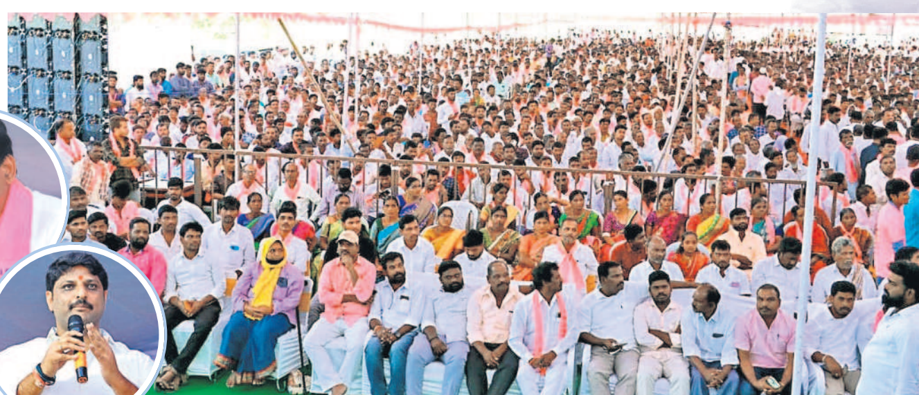
కార్యక్రమానికి హాజరైన బీఆర్ఎస్ శ్రేణులు, నాయకులు, ప్రజలు