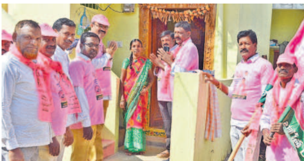
దుబ్బాకలో ప్రచారం నిర్వహిస్తున్న బీఆర్ఎస్ శ్రేణులు