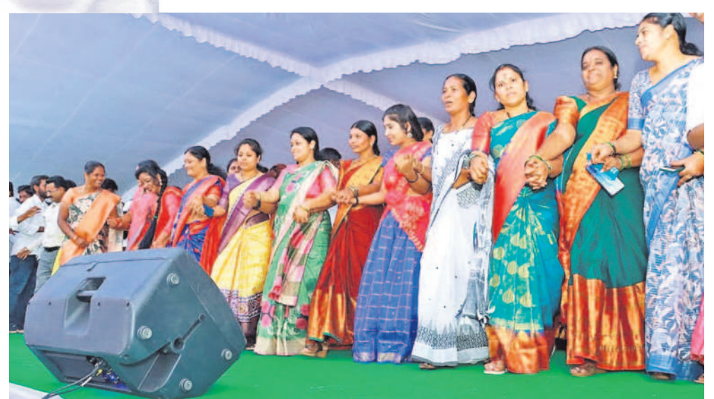
అందోల్: సృష్టం చేస్తున్న మహిళా ప్రజాప్రతినిధులు, కళాకారులు