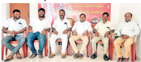
సమావేశంలో మాట్లాడుతున్న బీఆర్ఎస్ నాయకులు