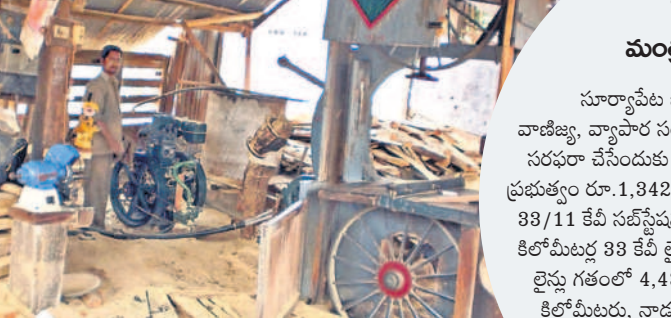
2014కు ముందు తిరుమలగిరి మండల కేంద్రంలోని ఓ. కట్టెకోత మిషన్లో ఆయిల్ ఇంజిన్ వినియోగం (ఫైల్)

సమైక్య పాలనలో విద్యుత్ కోతలతో జనం అరిగిపోవడం. కనీసం ఆరు గంటలు కూడా సరఫరా కాకపోవడంతో చిన్న, పెద్ద పరిశ్రమలు మూతపడిన పరిస్థితి. షాపులు, చిన్న చిన్న వ్యాపారాలు జనరేటర్లు, ఆయిల్ ఇంజిన్ల సాయంతో నడిపిన దుస్థితి. ఇండ్లల్లో ఇన్వర్టర్లు పెట్టుకున్నారు. నేడు ఆ పరిస్థితి మారింది. స్వరాష్ట్రంలో 24 గంటల విద్యుత్ సరఫరా చేస్తుండడంతో అన్ని వర్గాల ప్రజల బాధలు తప్పినాయి. ఆయిల్ ఇంజిన్ మోతలు ఆగినాయి. జనరేటర్లు కనపడకుండా పోయాయి. నాటి పరిస్థితులను తలుచుకుంటే వామ్నా.. అదో వీడక అంటున్నారు జనం. - సూర్యాపేట, అక్టోబర్ 27 (నమస్తే తెలంగాణ)