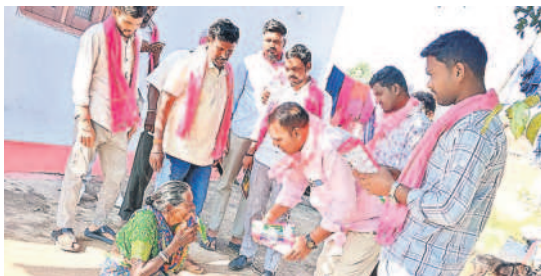
నాగిరెడ్డిపల్లిలో ఇంటింటి ప్రచారం నిర్వహిస్తున్న బీఆర్ఎస్ యువజన విభాగం నాయకులు