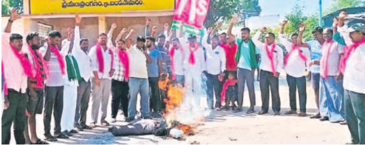
బండసామారంలో కాంగ్రెస్ నాయకుల దిష్టిబొమ్మను దహనం చేస్తున్న బీఆర్ఎస్ నాయకులు