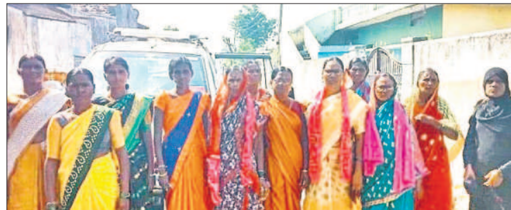
బేల : సభకు బయలుదేరిన పాటినీ గ్రామ మహిళలు