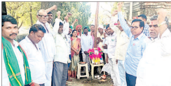
ఇంద్రవెల్లి: కుటుంబం భీం చిత్రపటం వద్ద నివాళులర్పిస్తున్న ప్రజాప్రతినిధులు, ఆదివాసి గిరిజనులు