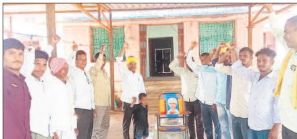
ఉట్లూర్: నివాళులర్పిస్తున్న నాయకులు