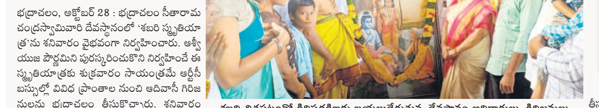
శబరి చిత్రపటంతో గిరిప్రదక్షిణకు బయలుదేరుతున్న దేవస్థానం అధికారులు, గిరిజనులు

భద్రాచలం, అక్టోబర్ 28 : భద్రాచలం సీతారామ చంద్రస్వామివారి దేవస్థానంలో శబరి స్మృతియాత్రను శనివారం వైభవంగా నిర్వహించారు. ఆశీర్వాయిణి పాక్షిమీని పురస్కరించుకొని నిర్వహించే ఈ స్మృతియాత్రకు శుభ్రవారం సాయంత్రమే ఆర్డీసీ బస్సులో వివిధ ప్రాంతాల నుంచి ఆదివాసి గిరిజనులు భద్రాచలం తీసువచ్చారు. శనివారం ఉదయం సందర్భంగా పూజలు నిర్వహించారు. అలయానికి విచ్చేసి తమ ఆరాధ్యదేవాలాన్ని దర్శించుకొని మురిసిపోయారు. ఎంతో కష్టపడి అడవి నుంచి సేకరించి సమర్పించారు. మేళతాళాలు, మంగళ వాయిద్యాలు, వేద