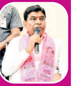
నామా నాగేశ్వరరావు, ఎంపీ

తుమ్మల వ్యాఖ్యలు బాధాకరం.. నా గురించి, సీఎం కేసీఆర్ గురించి మాజీ మంత్రి తుమ్మల అసత్య వ్యాఖ్యలు చేయడం బాధాకరం. తుమ్మల వైఖరిని నేను తీవ్రంగా ఖండిస్తున్నా. 25 ఏళ్ల రాజకీయ జీవితంలో నాపై ఒక్క అపవీతి మరక లేదు. నేను సంపాదించిన దానీలో కూడా కొంత ప్రజలకు ఇచ్చా. ప్రజాస్వామ్యంలో ఎవరు ఏ పార్టీలో వైనా ఉండొచ్చు.. కానీ కష్టతరంలో అన్ని విధాలా ఆదరంది, అక్కసనే చేర్చుకుని అండదండ ఎత్తివదిన కేటీఆర్ గురించి తప్పగా మాట్లాడుకుంటా ఉంటే తుమ్మల గౌరవం పెరిగేది. వాస్తవాలేమిటి తుమ్మల మనస్సు క్షీణి తెలుసు. అలాంటి బిల్లుకు సంబంధించి ఓటింగ్ పెట్టినప్పుడు నేనే మొదటి ఓటు వేసాను. ప్రజల ఆశ్చర్యంతో నేను పార్లమెంట్లో ఆడగ్గరి పెట్టాను. ప్రజలు గతంలో ఏ నాయకుడికి ఇవ్వని మెజిటీఫీ నాకు ఇచ్చారు. — నామా నాగేశ్వరరావు, ఎంపీ