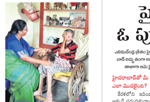
మాట తప్పని ముఖ్యమంత్రి