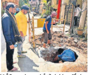
- జుబ్బిహిల్స్, అక్టోబర్ 28