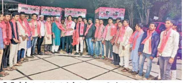
బీఆర్ఎస్ లో చేరిన కార్యకర్తలకు పార్టీ కండువలు కప్పి స్వాగతం పలుకుతున్న జుబ్బిహిల్స్ ఎమ్మెల్యే మాగంటి గోపినాథ్

ఎమ్మెల్యే మాగంటి సమక్షంలో పార్టీలో చేరిన ఎంఐఎం కార్యకర్తలు