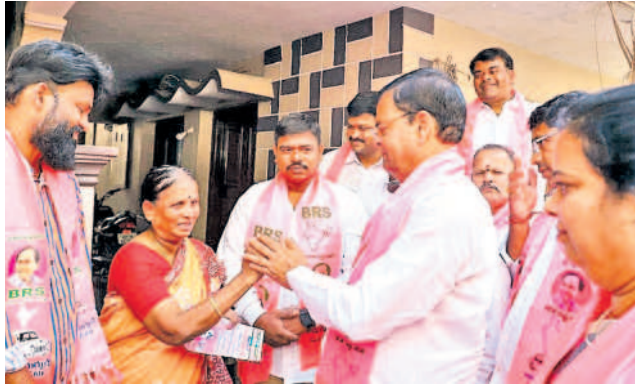
కారు గుర్తును మరచొద్దు అంటున్న ఎమ్మెల్యే అభ్యర్థి కాలేరు