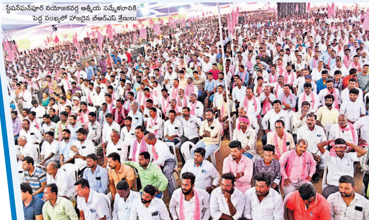
స్టేషన్ ఘనపూర్ నియోజకవర్గ ఆత్మీయ సమ్మేళనానికి పెద్ద సంఖ్యలో హాజరైన బీఆర్ఎస్ శ్రేణులు