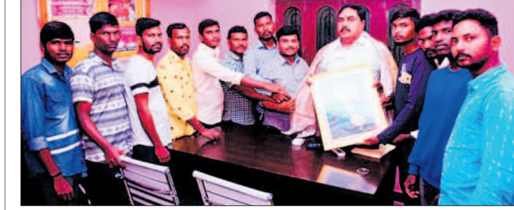
మంత్రి ఎర్రబెల్లికి అంబేద్కర్ చిత్ర పటాన్ని అందజేస్తున్న యూత్ సభ్యులు

ఎర్రబెల్లిని మర్యాదపూర్వకంగా కలిసి అంబేద్కర్ చిత్రపటాన్ని అందజేశారు. ఈ సందర్భంగా మంత్రి వారితో మాట్లాడుతూ అంబేద్కర్ ఆశయ సాధనకు ఐక్యంగా పనిచేద్దామని పిలుపునిచ్చారు. యూత్ ఐక్యంగా కేసీఆర్ ప్రభుత్వానికి మద్దతు తెలుపాలన్నారు. కాగా యూత్ కు తాను అన్ని రకాలుగా అండగా ఉంటానని తెలిపారు.