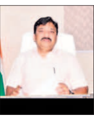
మాట్లాడుతున్న కలెక్టర్ శివలింగయ్య

జనగామ చౌరస్తా, అక్టోబర్ 28 : జిల్లా లోని జనగామ, స్టేషన్ ఘనపూర్, పాలకుర్తి మూడు అసెంబ్లీ నియోజకవర్గాల్లో పోస్టల్ బ్యాలెట్ కోసం అవకాశం కలిగి ఉండి వని యోగించుకోవాలనుకునే వారు నవంబర్ 7లోగా నిర్ణీత సమూహాల్లో ఫారం-12 (డీ) ద్వారా సంబంధిత రిటర్నింగ్ అధికారులకు దరఖాస్తు చేసుకోవాలని జిల్లా ఎన్నికల అధికారి, కలెక్టర్ సీహెచ్ శివలింగయ్య శనివారం ఒక ప్రకటనలో తెలిపారు. అత్యవసర సర్వీసు