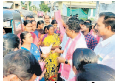
ఎన్నికల ప్రచారంలో లింగాల కమల్ రాజు