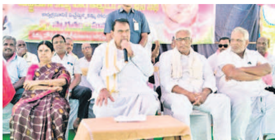
కమ్మ కులస్తుల ఆత్మీయ సమ్మేళనంలో మాట్లాడుతున్న స్పీకర్ పోచారం