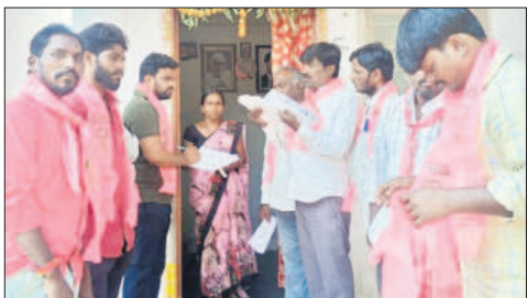
బాన్సువాడ పట్టణంలోని 8వ వార్డులో ప్రచారం చేస్తున్న బీఆర్ఎస్ నాయకులు