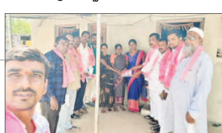
భిక్కనూరులో ప్రచారం చేస్తున్న ప్రజాప్రతినిధులు