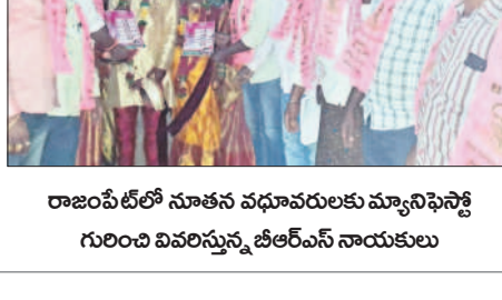
రాజంపేట్లో నూతన వధూవరులకు మ్యూనిసిపాలిటీ గురించి వివరిస్తున్న బీఆర్ఎస్ నాయకులు