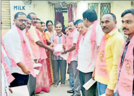
కామారెడ్డిలో ప్రచారం చేస్తున్న బీఆర్ఎస్ నాయకులు