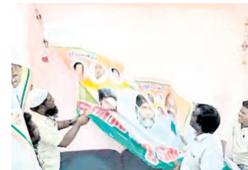
బెంసా: పార్టీ కార్యాలయం వద్ద ఫైట్స్ ని చించివేస్తున్న కార్యకర్తలు