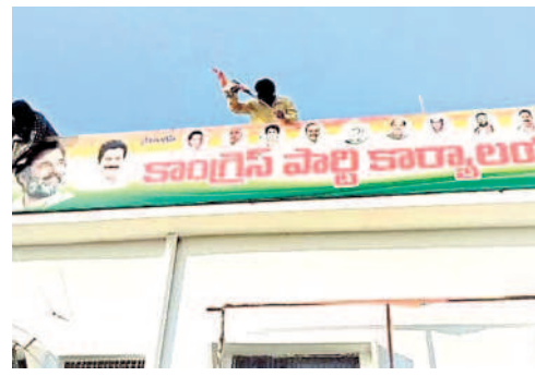
బెంసా: పార్టీ కార్యాలయంపై ఫైట్స్ ని తొలగిస్తున్న కార్యకర్తలు