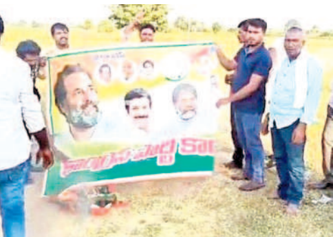
బెంసా: కాంగ్రెస్ ఫైట్స్ ని దగ్గం చేస్తున్న కార్యకర్తలు