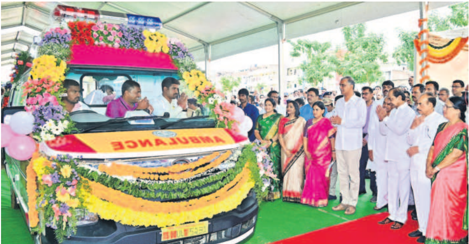
అంబులెన్సు సేవల విస్తరణలో భాగంగా.. ఈ ఏడాది అగస్టు 1న అంబులెన్సును ప్రారంభించిన సీఎం కేసీఆర్, చిత్రంలో మంత్రులు హాజరీకొని, మహామూలీ అలీ తదితరులు

సమైక్య పాలనలో దీనావస్థలో ప్రభుత్వ ఆస్పత్రులు స్వరాష్ట్రంలో సరికొత్త రూపు.. అత్యాధునిక వైద్యసేవలు రోబోటిక్ సర్జరీలు సైతం అందుబాటులోకి.. రూపాయి ఖర్చు లేకుండా కీలక ఆపరేషన్లు కిడ్నీ రోగులకు ఆపన్న హస్తం అందాలసిన కేంద్రాలు