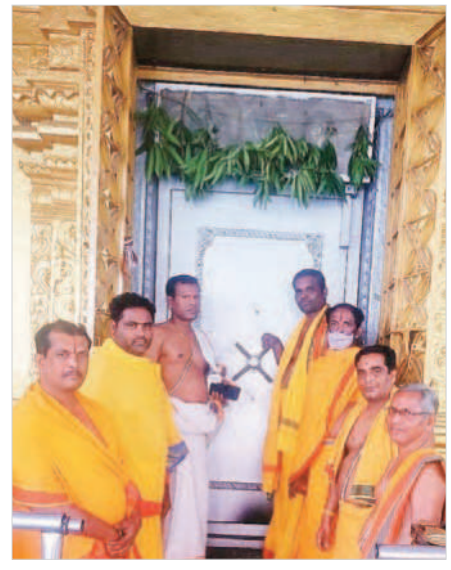
కురుమూర్తి ప్రధాన డ్వారం మూసివేస్తున్న అర్చకులు