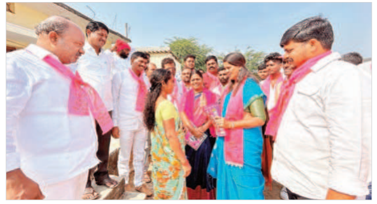
దేవరకర్త తండాలో ప్రచారం చేస్తున్న ఎమ్మెల్యే సతీమణి ఆల మంజుల

పెట్టిన ఎన్నికల మ్యానిఫెస్టోను గడపగడపకు వివరిస్తూ శనివారం బీఆర్ఎస్ శ్రేణులు విస్తృత ప్రచారం నిర్వహించారు.