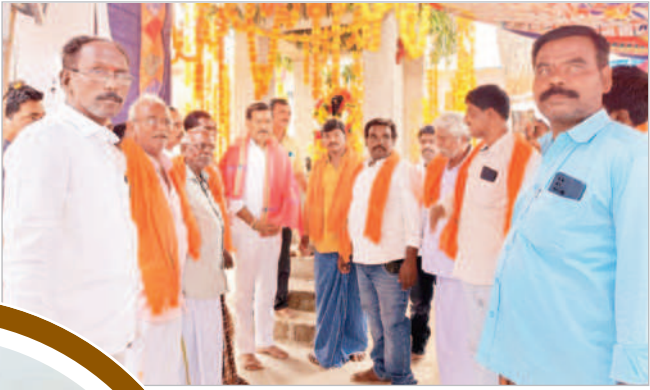
కొల్లాపూర్ : ఎల్లూరులో వాల్మీకి విగ్రహ ప్రతిష్ఠాలో ఎమ్మెల్యేను సన్మానిస్తున్న నిర్వాహకులు