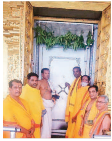
కురుమూర్తి ప్రధాన ద్వారం మూసివేస్తున్న అర్చకులు