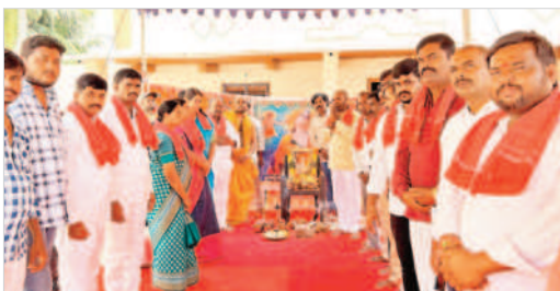
దేవరకర్త : వాల్మీకి జయంతిని నిర్వహిస్తున్న సభ్యులు